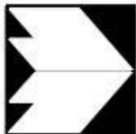
Abb. C.2: Mittlere Strömungsgeschwindigkeit im Gesamtgebiet, gesamte Kaltluftschicht