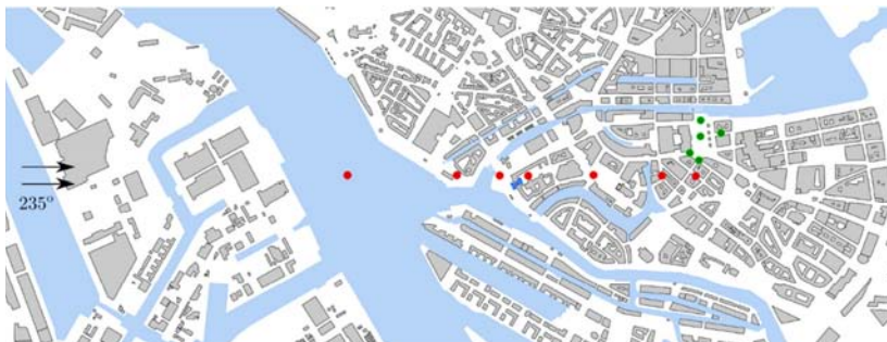
Abb. 1: Untersuchungsgebiet mit Profilpositionen (Leitl et al., 2012).

Unser Büro hat im Rahmen einer Projekterweiterung gemeinsam mit der Universität Hannover und den o. g. Partnern untersucht, ob das deutsche LES-Modell PALM (Parallelized Large-Eddy Simulation Model; Letzel et al., 2008) als alternativer Datenlieferant geeignet ist.